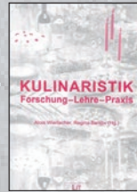
Bd. 1 der Reihe (2008)