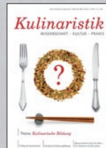
Kulinaristik 3 (2011)