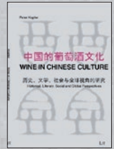
Bd. 2 der Reihe (2010)