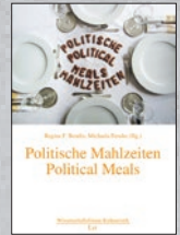
Bd. 4 der Reihe (2014)