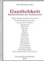
Bd. 3 der Reihe (2011)