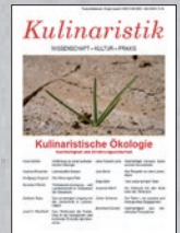
Kulinaristik 6 (2015)

Die Zeitschrift „Kulinaristik“ ist auch als Abo erhältlich. Weitere Infos unter www.kulinaristik.net