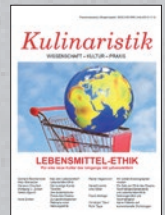
Kulinaristik 4 (2012)