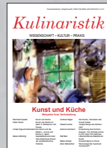
Kulinaristik 5 (2013)